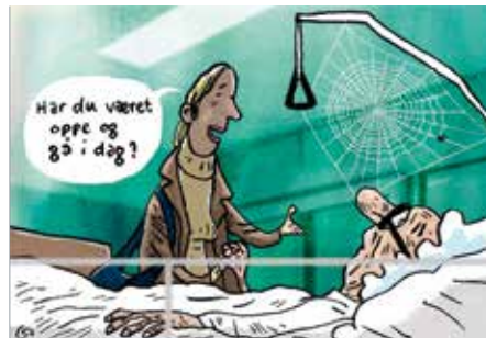
ILLUSTRATION: GITTE SKOV

I undersøgelsen blev indlagte patienter inddelt i to grupper. Den ene gruppe modtog den traditionelle behandling, mens den anden gruppe blev hjulpet ud af sengen to gange hver dag i mellem 15 og 20 minutter.