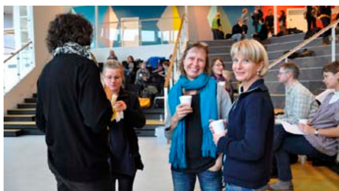
Minifagfestivalen byder ikke kun på spændende ny faglig viden – den er også en oplagt mulighed for at møde kolleger og fagfæller og få plejet sit netværk.

Minifagfestivalen arrangeres af en arbejdsgruppe bestående af regionsbestyrelsesmedlemmer samt andre interesserede medlemmer, der ønsker at være med i planlægningen. Regionsbestyrelsen arbejder også på en Minifagfestival ultimo 2013. ■