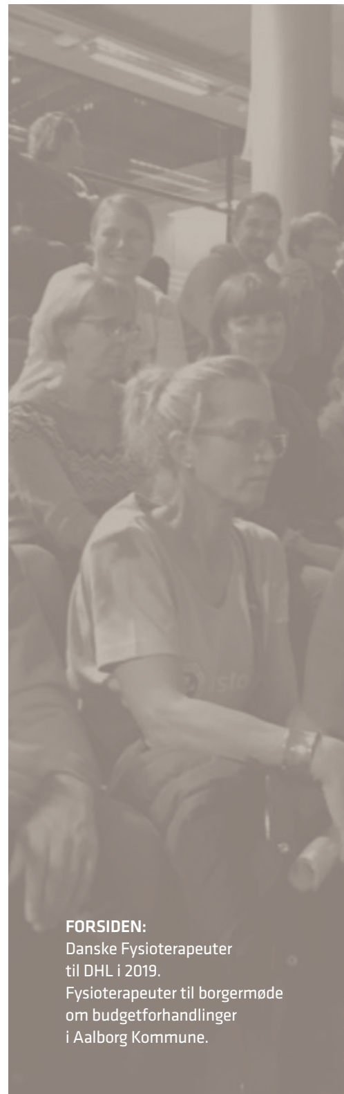
FORSIDEN: Danske Fysioterapeuter til DHL i 2019. Fysioterapeuter til borgermøde om budgetforhandlinger i Aalborg Kommune.