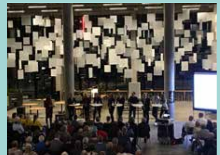
Der var flere end 300 deltagere til borgermødet ifølge TV 2 Nord.