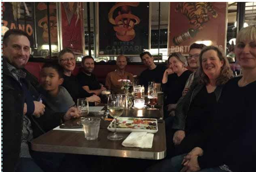
Stemningen var god til regionbestyrelsens første fredagsbar og hverdags eksperiment i Slagelse i efteråret 2019.

Derudover arbejder regionsbestyrelsen forsat med netværkstankegangen og med at få inddraget lokale videnspersoner, som har ekspertviden på et særligt område. Det kunne eksempelvis være, når der skal holdes faglige arrangementer, eller hvis der er en sag i en af kommunerne eksempelvis på børneområdet, hvor der er brug for en person med ekspertviden om netop det.