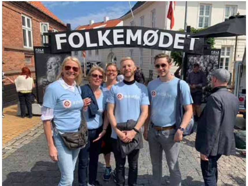
Danske Fysioterapeuters logo blev vist frem på Folkemødet i Allinge, som slog besøgsrekorder det år. Da Folkemødet var slut, havde 114.000 besøgende været forbi.

Regionsbestyrelsen havde en fælles stand med Dansk Sygeplejeråd, Ergoterapeutforeningen og Jordemoderforeningen. Der var ikke noget folkemøde hverken på Bornholm eller Møn i 2020, da arrangementerne blev aflyst på grund af Corona. Men det er planen, at Folkemødet i Allinge skal afholdes til sommer i en udgave med nye formater, som er tilpasset Corona-situationen. Folkemøde Møn håber at kunne afvikle mødet på næsten normal vis, da det først er planlagt til afholdelse i slutningen af august.