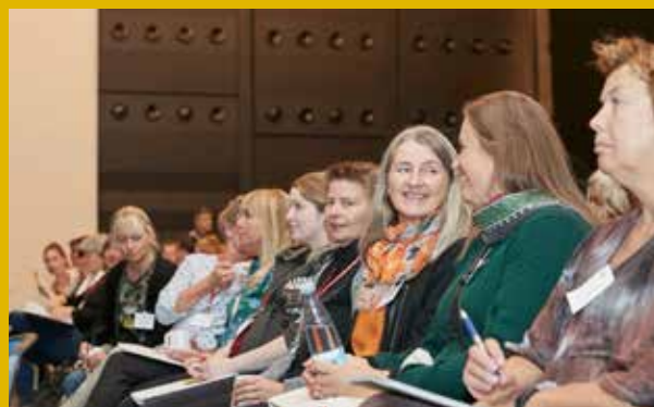
Robotter og fremtidens patienter var også på programmet til fagkongressen, hvor omkring 100 fysioterapeuter deltog.