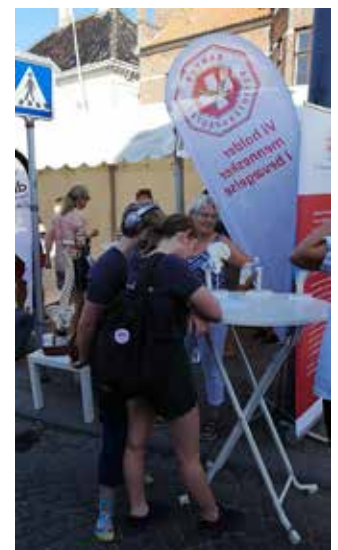
Til Folkemøde Møn hjalp Stege Fysioterapiklinik med at bemande Danske Fysioterapeuters stand. Klinikken holdt blandt andet en quiz om kroppen.