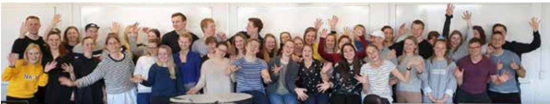
Afgangsholdet fra fysioterapeutuddannelsen i Odense i foråret 2019.