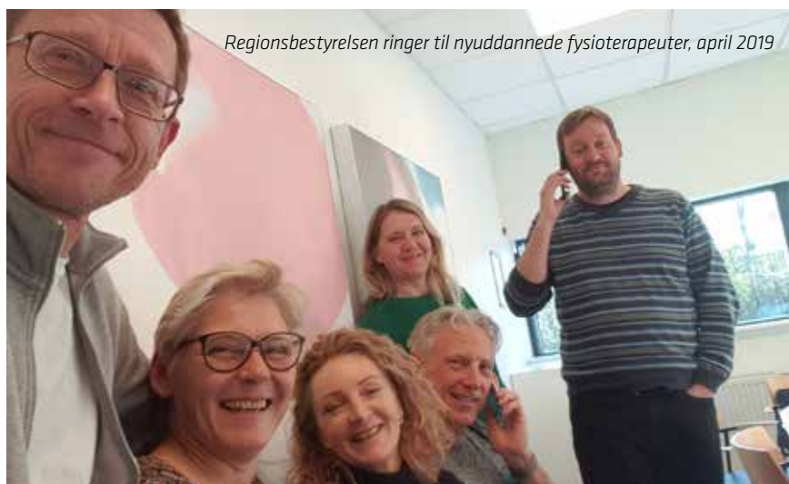
Regionsbestyrelsen ringer til nyuddannede fysioterapeuter, april 2019

TO GANGE OM ÅRET ringer regionsbestyrelsen til de nyuddannede fysioterapeuter for at ønske dem tillykke og høre om deres jobsituation. De fortæller samtidig om Danske Fysioterapeuter, og hvad de nye fysioterapeuter kan bruge foreningen til.