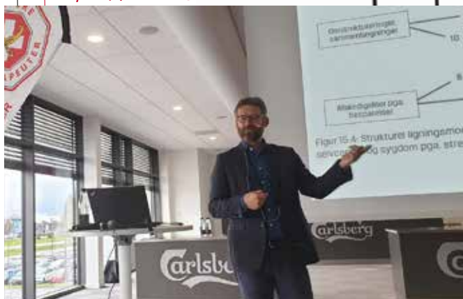
Der var stort fremmøde til den regionale fagfestival om stress i slutningen af 2019.