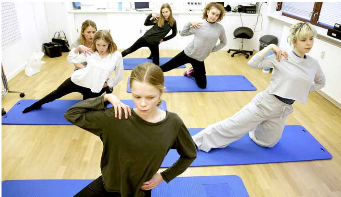
Børnene kommer langvejs fra. En af mødrene og hendes 16-årige datter kommer fra Aarhus. De har været i København et par dage for at få en kontrollkonsultation og et par træningssessioner på holdet.

⇒ børnene og de unge, der har været på klinikken, om. Flere af dem er blevet smertefrie efter træningen, der også har mindsket kurverne i ryggen. Nogle af dem har valgt at få lavet et korset i Tyskland, som de bærer døgnet rundt.